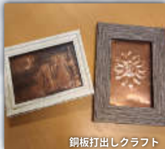
銅板打出クラフト