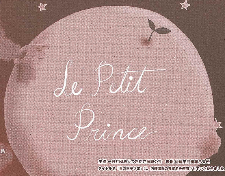
主催 一般社団法人つきだて振興公社 後援 伊達市月館総合支所 タイトル名「星の王子さま」は、内藤濯氏の考案名を使用させていただきました。

オープニングアクト つきだて花工房リーディングアラウドの会 「あかり」(光村教育図書) 文: 林 木林 「ぼんぼん山の月」(文研出版) 文: あまんきみこ