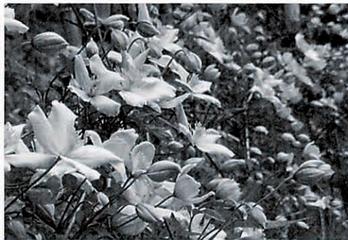
一面に咲くクレマチスの花

そよ風が植物のかすかな香りを運んできました。フェンス、面につたうクレマチスの香りです。よく見ると、花びらは淡いピンク色、顔を近づけると甘くやさしい香りがして、もうそれだけで二日が幸せな感じ。花の名前はモンタナ・エリザベス。クレマチスの中では早咲きの品種で、たくさん蕾が次々に咲き続け、その名のごとく優雅な庭を演出してくれます。