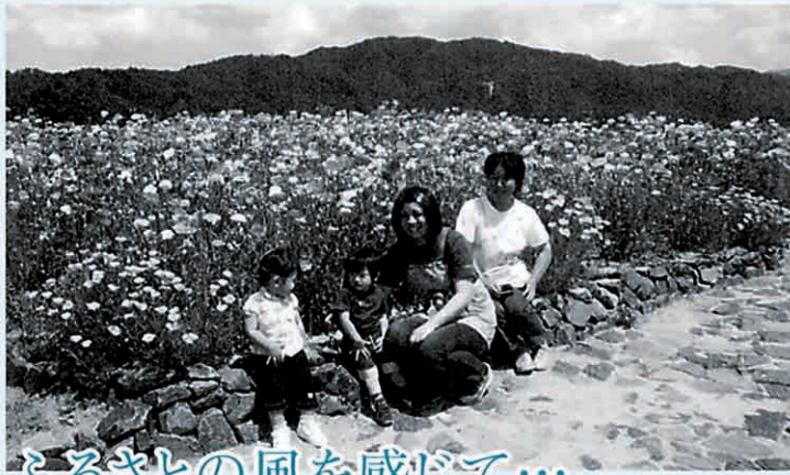
ふるさとの風を感じて...