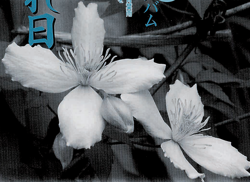
クレマチスの花 モンタナ・エリザベス 高野憲二さんの庭にて(月舘町、御代田)

雨の日を乐しむ 青時雨 青梅雨 青曇雨 沢山の雨の呼び名を 並べてみたり 降る雨を ただ、ぼんやりと 眺めてみたり 雨あがりの 虹のアーチを 想像したり！