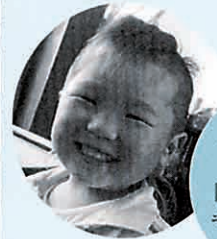
キッズスマイル 「僕のヘアスタイル、キマッテルでしょ！」