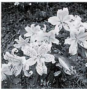
蕾は下を向き、花は横に咲き 果実が熟すると上を向くヤマユリ (つきだて花工房・遊歩道)

ユリはユリ科ユリ属の球根植物。一球一茎で、6枚の花びらのうち、外側の3枚はやや小さく、花びらの先が反転するのが特徴です。ヤマユリは東北地方から関西地方に分布する日本特有のユリで、古名を「佐草」、学名を「アウラツム」(黄金色)と呼びます。横向きに咲く白い花の中央には黄色く太い帯があり、全体にちらばる紅褐色の斑点が、野生のユリの美しさを強調しています。