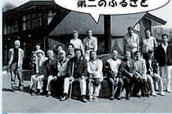
千葉県白井市「あそびね会」のみなさま