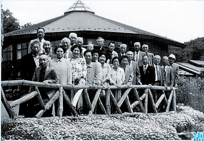
恩師を囲んで「一六会」のみなさま