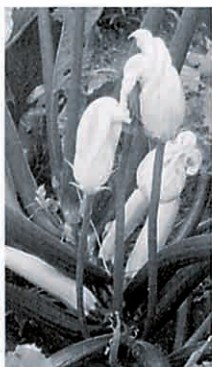
やさい工房会員 千葉さんの畑のズッキーニ 手前は雄花

このズッキーニ、成長がすぐぶる早いので、こまめに畑の見まわりが必要で、おいしき目安は20センチくらい。もし収穫を逃がすと、信じられない大きさに(たとえば40センチくらい)のへちまのように変貌します。これも又、野菜づくりの楽しみでしょうか？