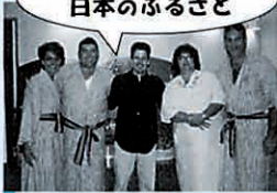
アメリカ リビア市から