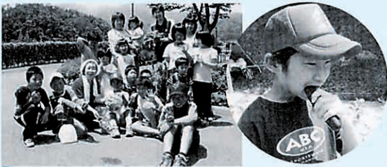
大地の恵み もりもり体験