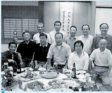
幼なじみの思い出は…「二八会」のみなさま

あわただしく流れる時間と並行に、「こつきだて花工房」には、もう一つのゆるやかな時間が流れています。花や木や風、月や星に心を傾けながら過ごすことができる幸せを、これからも、出会えるひとりとひとりと一緒に大切にして行けたらと思います。