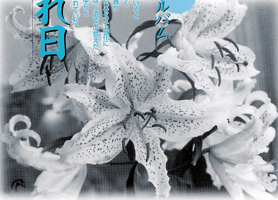
月館町 町花 ヤマユリ

涼風を求めて 雑木林を歩いてみると どこからともなく ヤマユリの花の香り 里山に初夏を知らせるその花に 今年もまた、おなじ道で出会えた その花は、ゆらゆらと かすかな風に揺れていた