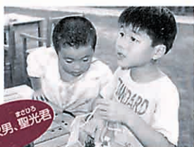
東京都・ 次男、野光君

お父さんは、風邪をひいていて可愛そ うでしたね。次回は体調を整えて遊びに 来てください。フ ルートも聴かせ てほしいです。お 母さんにもよろ しくお伝えくだ さい。また、来年 の夏も会えると いいね…。