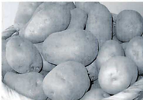
花工房産・男爵、メイクイーン、アンデス、きたあかり

今年、つきだて花工房の「もりもり農園」では4種類のジャガイモを作りました。男爵、メイクイーン、アンデス、きたあかり。おいしい太陽と空気をいっぱい受けたジャガイモはしっかりと身がしまり、ホクホク派も、ねっとり派もとっても美味しくできました。ジャガイモは栄養価が非常に高く、小麦、トウモロコシ、お米とともに4大デンプン作物と言われています。 ナス科の多年草。白や淡いピンクのジャガイモの花は遠くからでも目を引く可憐な花です。