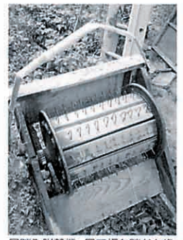
足踏み脱穀機。足で板を踏むと回ったドラムが回り脱穀する

●つきだて夢見の郷宅地分譲 残り15区画、平均区画面積130坪・平均坪単価4万4千円。購入者、仲介者に奨励金あり。 お問合せ先 月館町役場企画課 024(572)2111