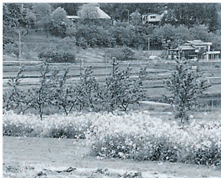
だいの花が揺れる5月の風景

日本の代表的な野菜「大根」。そ の栽培面積は野菜の中で最も広く、 各地方で周年栽培が可能、その品種 は100を超えるといわれます。春 の七草のひとつ「すずしろ」は大根の 古名であることはご存知でしょう。