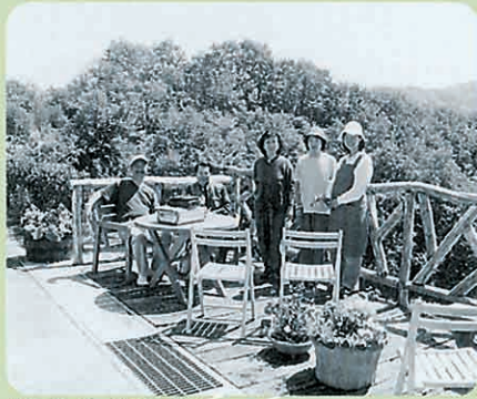
朝のおいしい空気の中で

新緑の季節は、自然から元気をいっぱいもらえます。今日も花工房のどかな一日がはじまりました。10時からは絵手紙教室。早めに到着した生徒さんは、すでに野の花を摘んでじっくり観察。「ハルジオン、ハハコグサ、えっ！この小さな花はなあーに？」和田先生を囲んで、教室がはじまる前のなごやかなおしゃべり。みなさんの顔には元気な笑顔があふれていました。