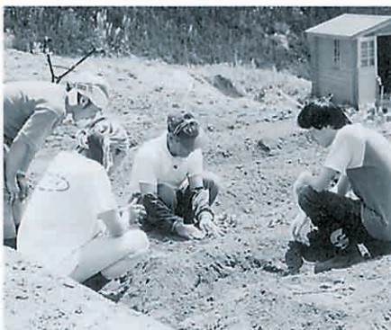
農業体験・さつまいもを育てる

「この列、俺の分！」和気あいあいと 皆で土に親しむ時間は、日頃の雑踏 を忘れさせてくれる大切な時間です。 午後からは花工房ではおなじみのズ ッキー・ブッチャーニを定植しました。 長い間、晴天が続いていましたが、こ の日は夕刻に恵みの雨が降りました。 みるみるうちに新緑が濃くなり、雨 があがると大きな虹が架かりました。 自然界の魔法のような演出に、ただ ただ感嘆した二隣でした。