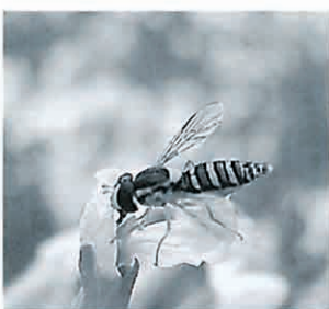
お食事中にごめんない 大根の花はどんな蜜の味？