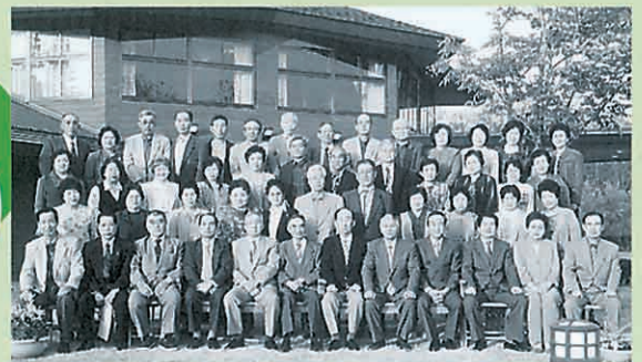
平成13年4月30日「二六会」の皆さま つきだて花工房にて