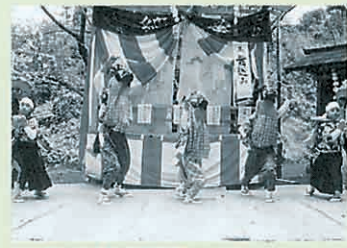
小志貴神社の牡丹獅子舞

A 以前は婦人会の方が衣裳を縫ってくれましたが、残念なことに今では「たつつけ袴」を縫える人がなく、専門店にお願いしています。今回は「宝くじ記念財団」