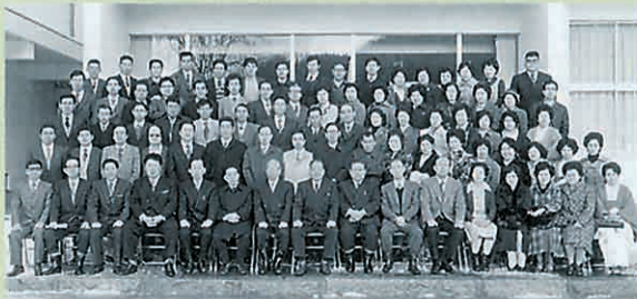
昭和52年1月3日 月館小学校にて

風薫る季節、ふるさと月館で懐かしい友との再会。 尽きることなく思い出話に花が咲き……。 さらに懐かしい写真にはお元気だった頃の恩師の姿。 感謝の心を忘れることなく……。